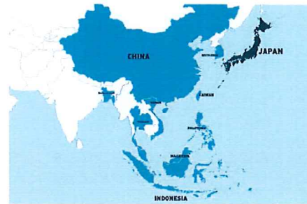
マーケットマップ

「また、鉄スクラップは需要があり、カーボンニュートラルという目標にも合致しているため、注目したいと考えています。」国連の持続可能な開発目標にコミットしている同社は、より環境に優しい未